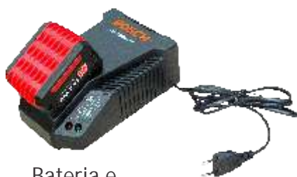
Bateria e Carregador